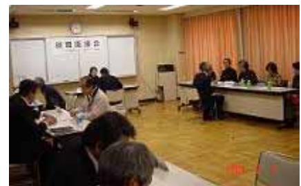
前回の合同面接会では5名の 受講生が採用されました。